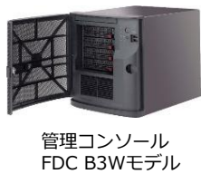
管理コンソール FDC B3Wモデル

管理コンソールを導入すると、小規模～大規模まで FFRI yarai が導入された全ての端末を一元管理することが可能になります。