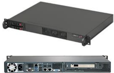
【ラックマウント型(1U):FDC T2W】