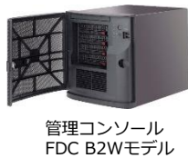
管理コンソール FDC B2Wモデル

管理コンソールを導入すると、小規模～大規模まで FFR yarai が導入された全ての端末を一元管理することが可能になります。