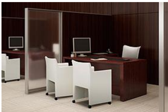
※テーブル上に設置した事例写真

お客様への金融・保険コンサルティングは個人のプライバシーを最大限に保護した環境でのご提案が重要です。テーブル上にLAN Sheet®を設置すると、机上だけに限定した無線環境を構築できるので、セキュリティを物理的に担保した運用が可能になります。