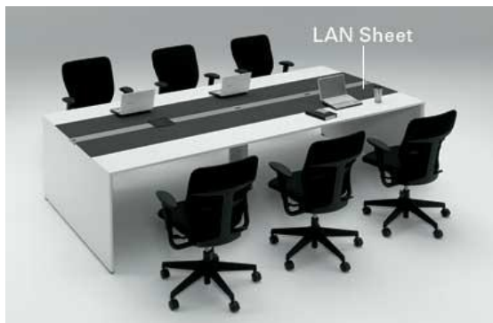
※テーブル上に設置した事例写真